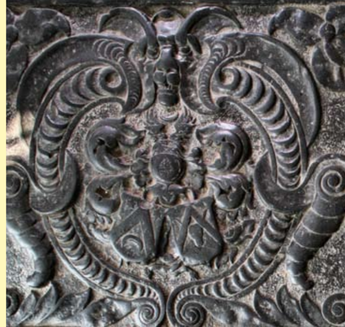
5 Fragment van de grafzerk voor Wytzia Nunninchof (nr. 4)

In alle kerken die de Stichting Oude Groninger Kerken beheert worden bijzondere activiteiten aangeboden. In deze rubriek lichten we een aantal daarvan uit. Voor een compleet en actueel overzicht kunt u terecht op de website www.groningerkerken.nl/agenda . Mocht u geen beschikking over een internetverbinding hebben, dan kunt u contact opnemen met het secretariaat van de Stichting. De medewerkers kunnen u van een papieren agenda voorzien.