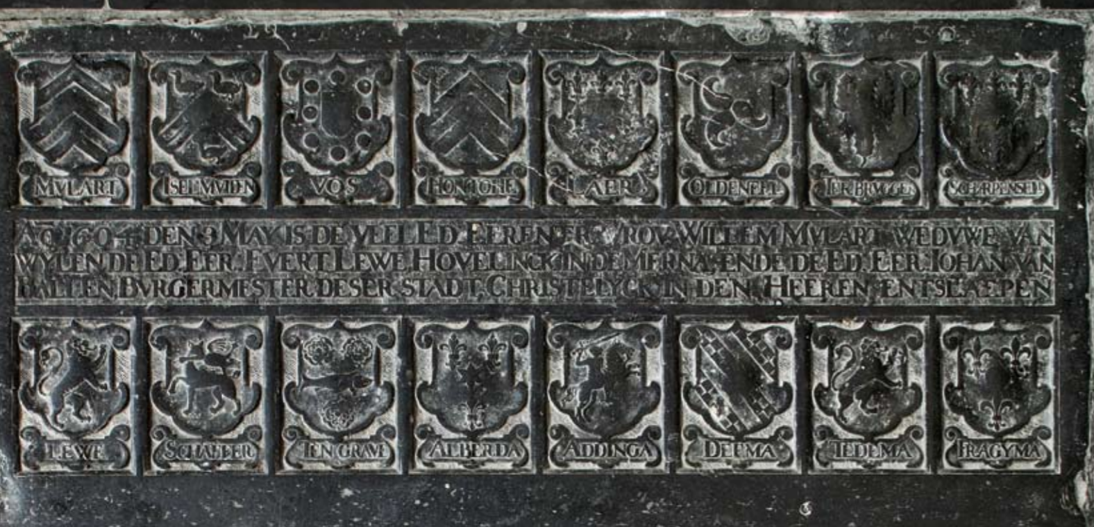
4 Fragment van de grafzerk voor Willem Mulert (nr. 3)