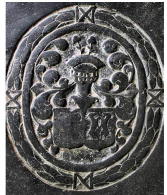
3 Fragment van de grafzerk met de wapens Van Pewsum-Coenders (nr. 2)