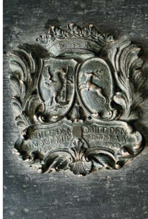
9 Fragment van een grafzerk met wapens Gockinga-De Bringues (nr. 7)

afkomst van zijn vrouw van belang was, blijkt bovendien uit het feit dat ook haar kwartieren op zijn grafzerk zijn opgenomen: meestal worden van een man alleen zijn eigen kwartieren, en niet met die van zijn vrouw afgebeeld.