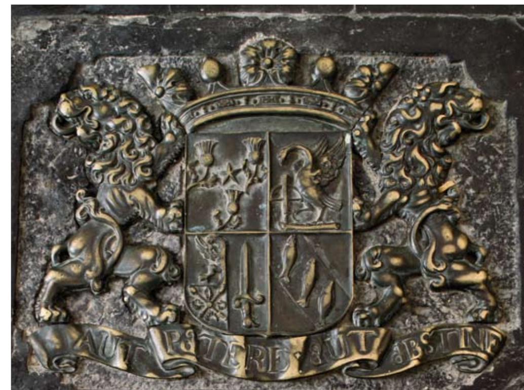
11 Fragment van de grafzerk voor een lid van de familie Verrutius (nr. 9)

van de vier kwartieren uit een oud stad-Groninger geslacht; de overige drie families waren in het begin van de zeventiende eeuw tot aanzien gekomen. Er werd dus bewust voor vier kwartieren gekozen, en wel in de vorm van één gevierendeeld wapenschild.