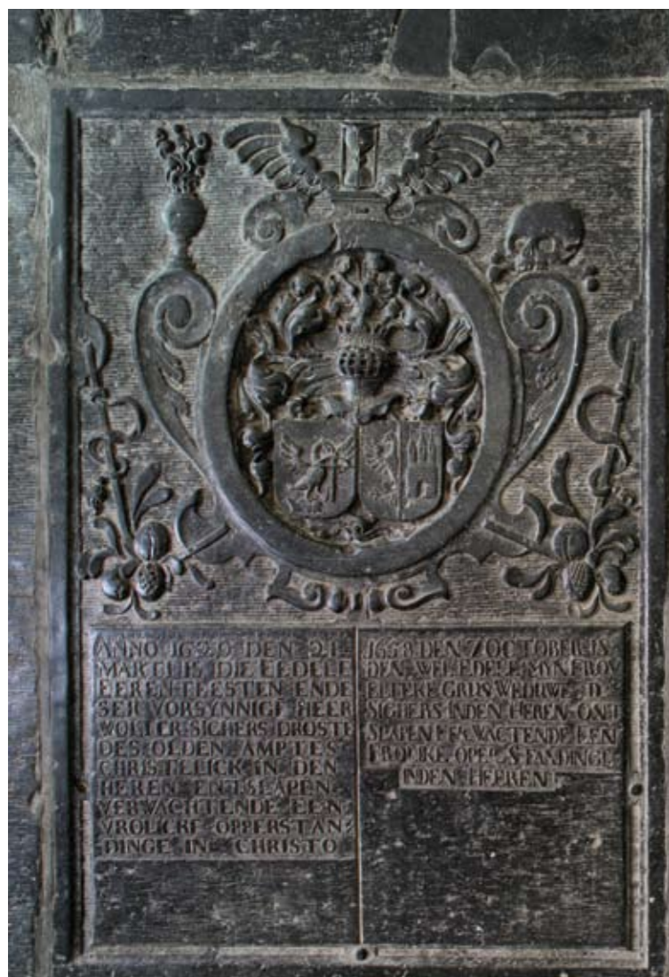
14 Fragment van de grafzerk van Wolter Sighers en Elteke Gruys (nr. 13)

Onder de grafzerk (nr. 17) voor Johan van de Kornput († 1611) 20 ligt een bekende Nederlander, hoewel deze militair, kaartmaker en vestingbouwer in Groningen zelf