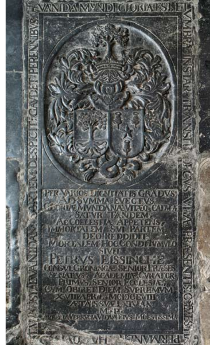
10 Grafzerk voor Petrus Eissinghe (nr. 8)

van de vier kwartieren uit een oud stad-Groninger geslacht; de overige drie families waren in het begin van de zeventiende eeuw tot aanzien gekomen. Er werd dus bewust voor vier kwartieren gekozen, en wel in de vorm van één gevierendeeld wapenschild.