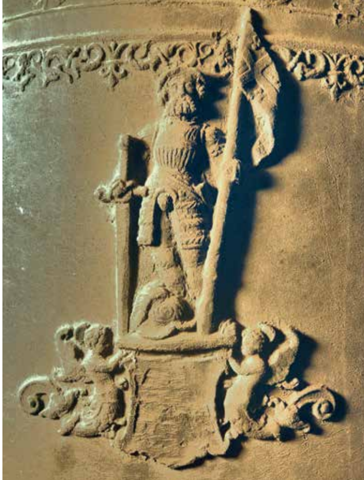
17 Afbeelding van Pontianus op de achterzijde van de klok.