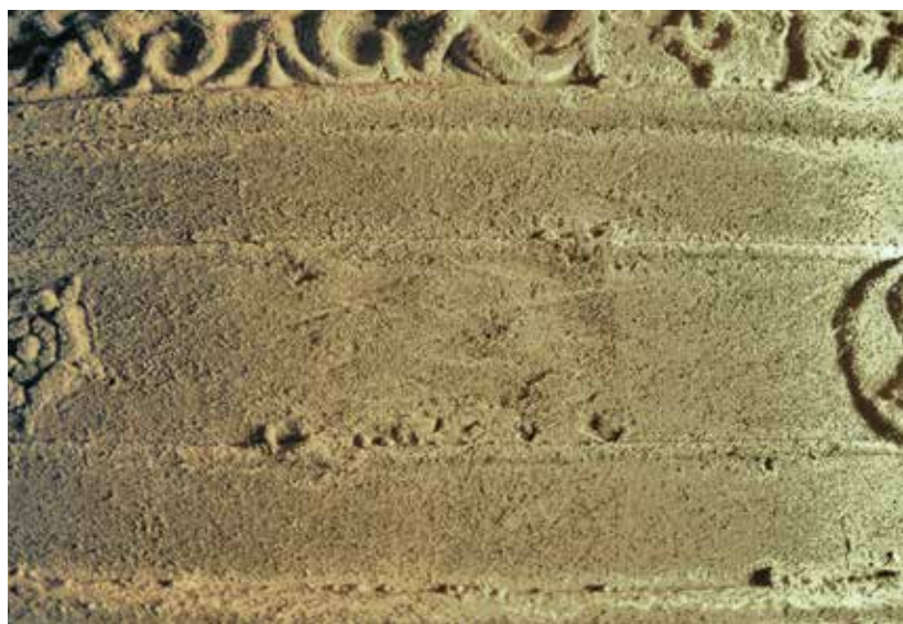
9 Een van de onleesbaar gemaakte woorden ('zael'). Zichtbaar zijn echter het haaltje van de 'z', het boogje bovenaan de 'e' en de stok van de 'l'.