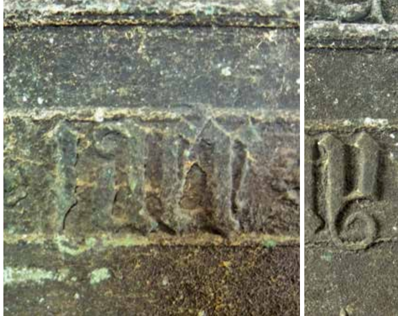
7 Het woord 'jaer' op de klok van Bolsward. Voor de j is de linkerhelft van de letter y gebruikt.