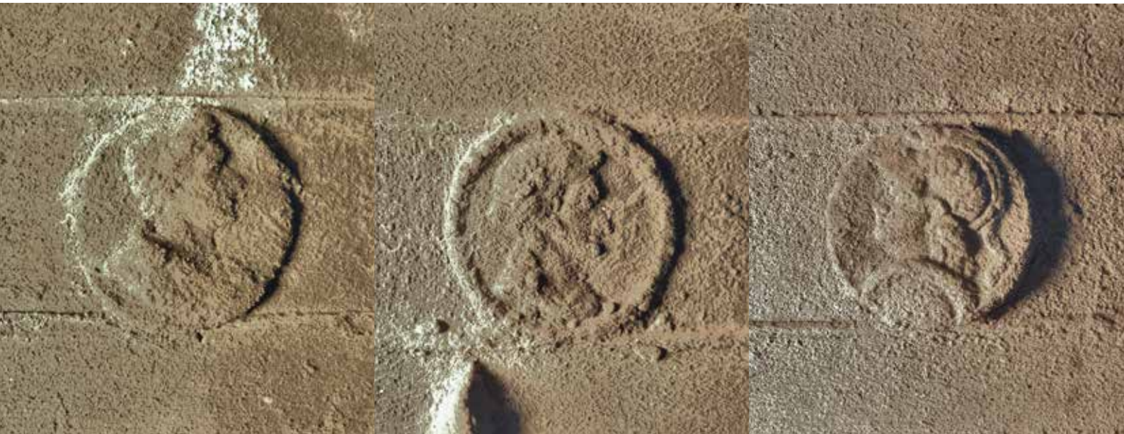
5 Medaillons in klassieke stijl in de tekstband.

Nauwkeurige bestudering van de foto's leerde verder dat links van het jaartal een x weggekapt is, nauwelijks waarneembaar op de klok zelf, maar onmiskenbaar op de met strijklicht genomen detailfoto's. Rechts van het jaartal is ook iets weggekapt en ongetwijfeld heeft daar nog een i gestaan. De klok dateert dus niet uit 1527, maar uit 1538.