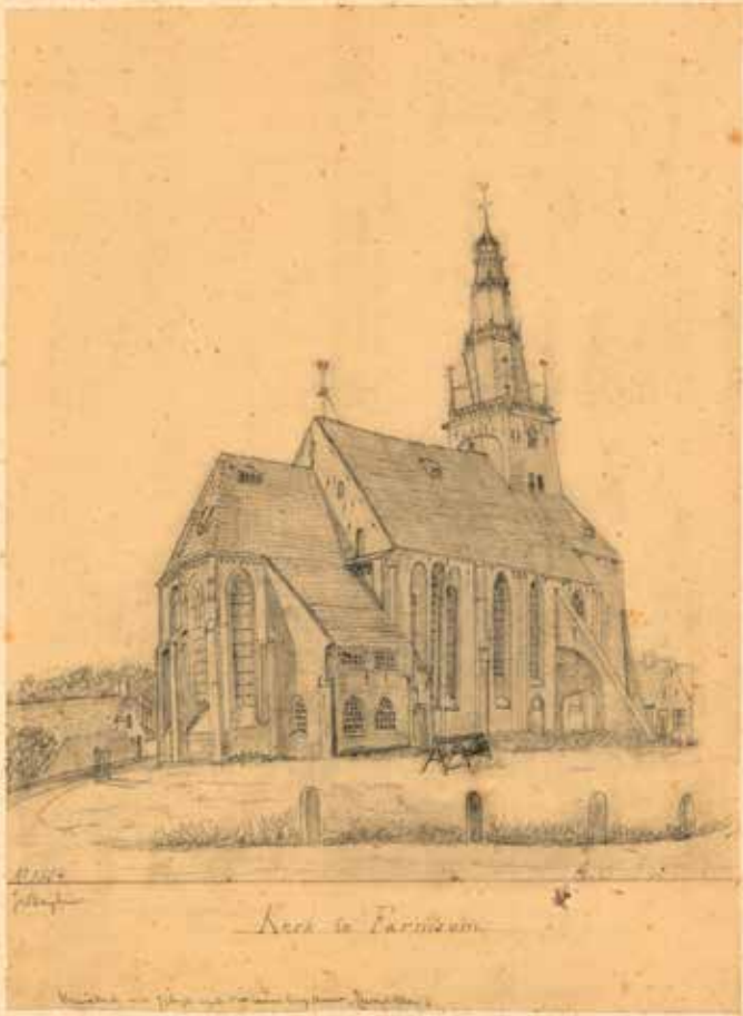
3 De middeleeuwse kerk van Farmsum, in 1854 getekend door J. Berghuis (natekening door C.H. Peters). Collectie RHC Groninger Archieven (1536-167).