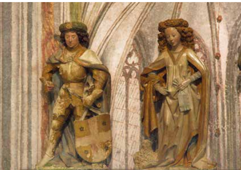
16 (onder) Pontianus en Agnes, twee kalkstenen beelden door Jan Nude (ca. 1450).