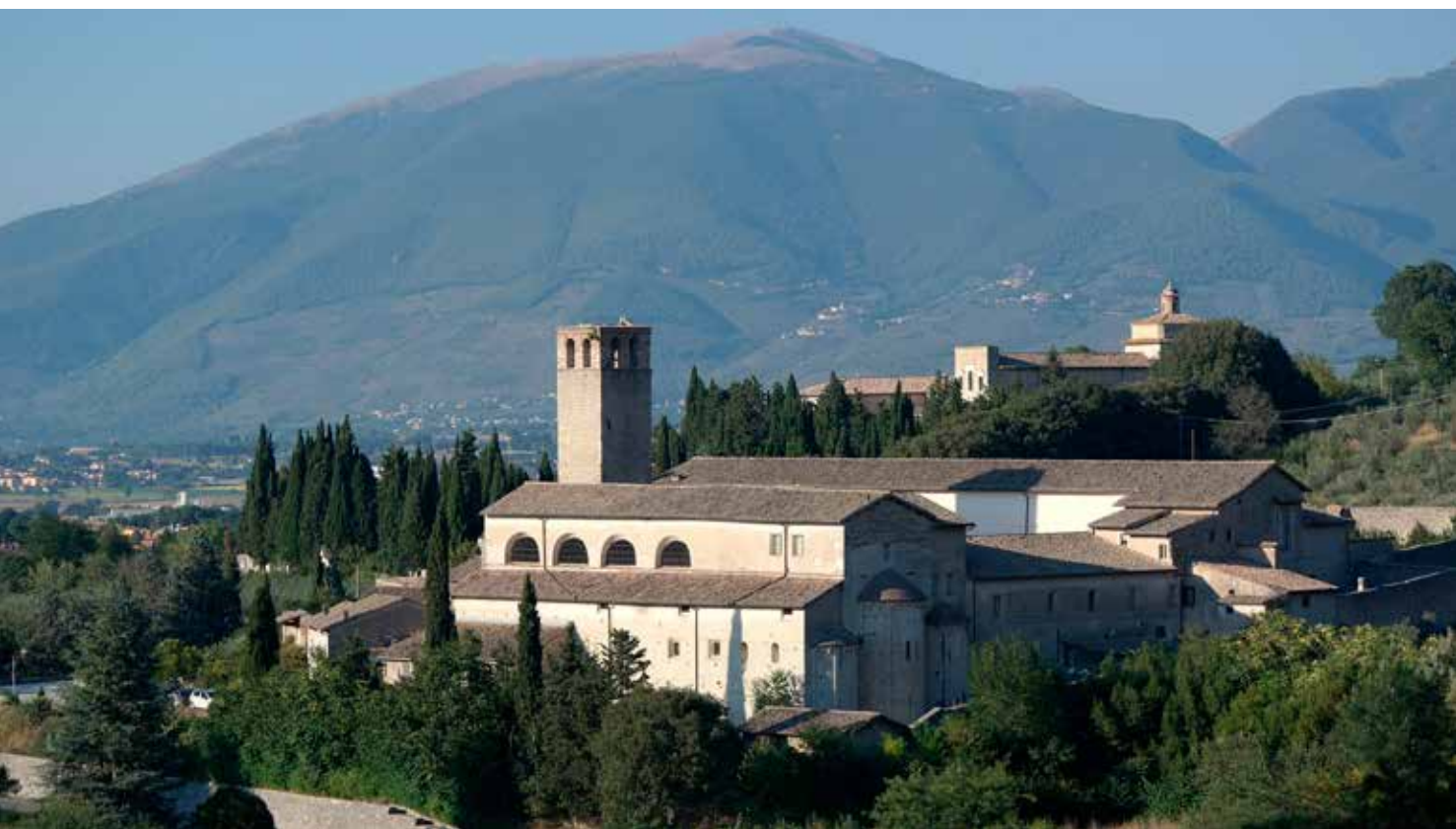
12 Kerk en klooster van San Ponziano te Spoleto.

Tot zover verschilt zijn levensverhaal niet van dat van veel vroegchristelijke martelaren bij wie we de verschillende elementen van Pontianus' levensbeschrijving herhaaldelijk aantreffen.