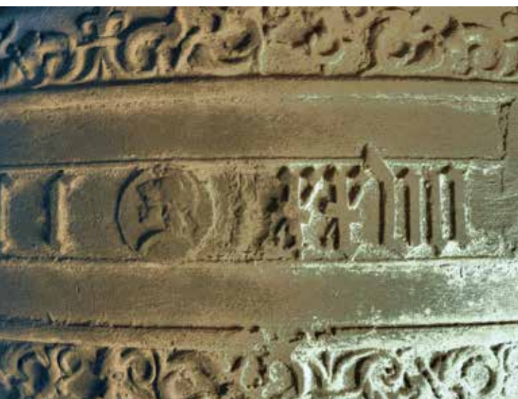
8 Het jaartal xxvii (1527); links is een x weggekapt en rechts een i. Foto Redmer Alma.