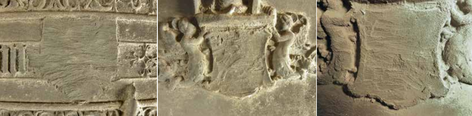
11 Van links naar rechts: wapen in het randschrift, aan de voorzijde en aan de achterzijde van de klok.