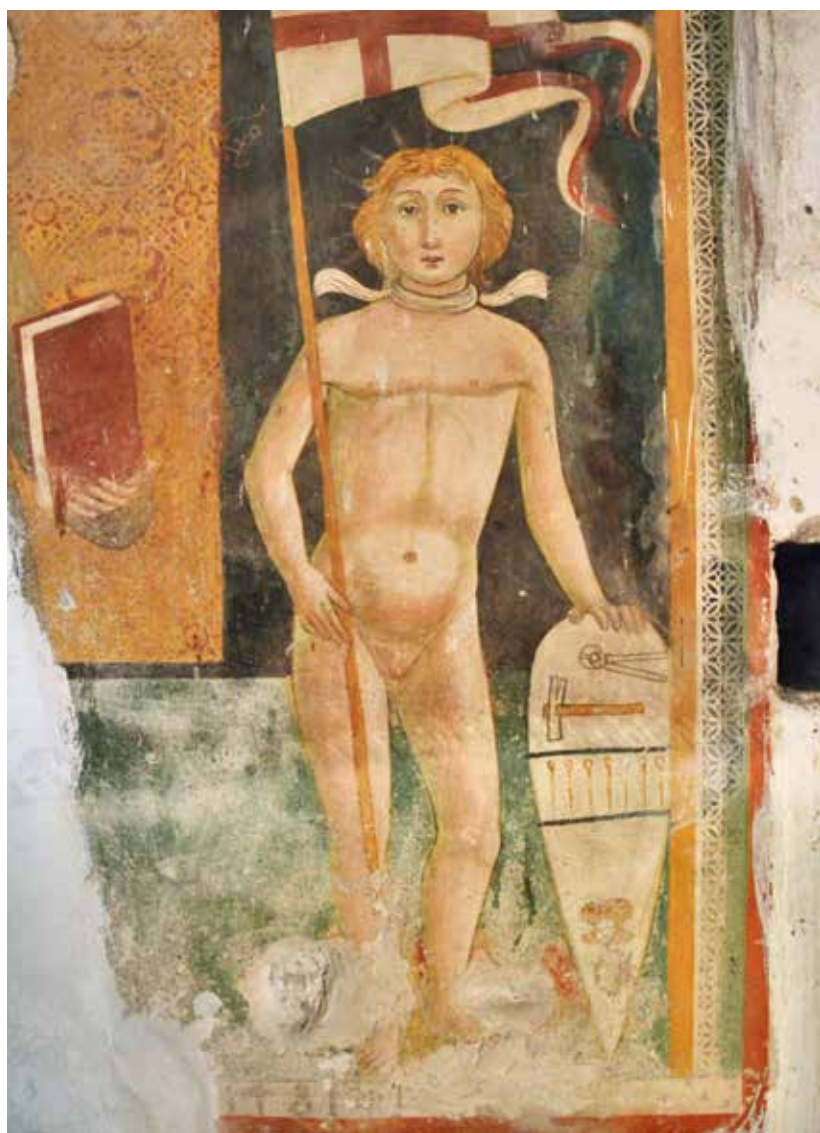
13 Fresco in de linkerzijkapel in de San Ponziano (1481).

Van Pontianus is slechts een klein aantal oudere afbeeldingen bekend. In en rond Spoleto is een tiental bewaard gebleven. De heilige wordt daarop als zelfbewuste jonge ridder of als kwetsbare, naakte jongeman weergegeven. Voorts zijn er