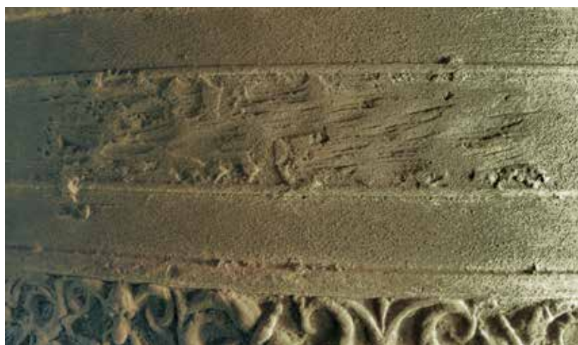
10 De naam van de klok, die zich moeizaam prijs gaf: poncyæn.

poncyæn heet ick / goebel zael heeft myn ghegoten int jaer ons heeren m ccccc xxxviii