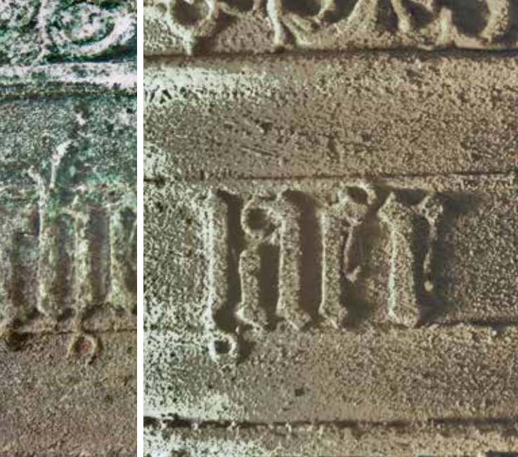
6 Het nog leesbare woord 'jaer' op de klok van Farmsum. De j is gevormd uit de rechterhelft van de letter h.