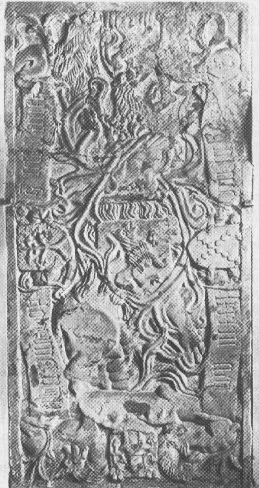
Grafsteen van Abel Onsta, hoofdeling te Sauwerd (overl. 1483). Boven en in het midden staat het wapen-Onsta; rechts dat van zijn grootvader, de bekende Vetkoper Feye van Dockum.

Vanaf de gijzelneming te Emden treden de hoofdelingen op onder de term Ridderschap. Tot nu toe werd aan dit verschijnsel in de geschiedenis van de Ommelander hoofdelingen weinig aandacht besteed, maar alles wijst er op dat het niet een toevallige verzamelnaam was. De Ommelander adel heeft door het vormen van een ridderschap getracht zich een plaats in de staatkundige structuur onder de nieuwe landsheer te verwerven en sloot met deze