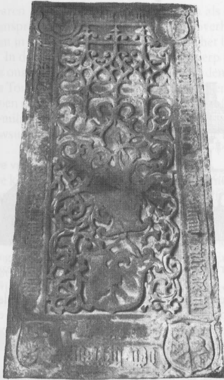
Grafsteen van Eyske Sceltcuma te Zandeweer (overl. 1540). Linksboven is het wapen van de familie Sygers te Appingedam zichtbaar, rechtsboven dat van de familie Hillebrants te Groningen.

Ondanks alle gebreken straalt ook de tweede conclusie van deze tabel ons tegemoet: er is binnen de Ommelanden bij de groep hoofdelingen een opvallende geslotenheid te constateren. Die geslotenheid is nog groter dan hierboven aangegeven, als we ons realiseren dat zes van deze huwelijken van hoofdelingen met niet-hoofdelingskinderen bij slechts twee families optreden, namelijk de hoofdelingen te Rasquert en Zandeweer. Met name die te Zandeweer zijn een geval apart. De zestiende-eeuwse huwelijken in de categorie 'diversen' zijn op andere wijze te verklaren, maar daarover later. Deze tabel en de conclusies ten aanzien van de geslotenheid hebben enkel betrekking op het hoofdelingschap en niet op het connubium van de jongere dochters en zonen. We zullen hierop in dit verband niet nader ingaan, maar merken slechts op dat dit connubium minder was. Interessant is dat van de twee kenmerken van de vererving van het hoofdelingschap, de voorkeur voor agnatische vererving en een zekere